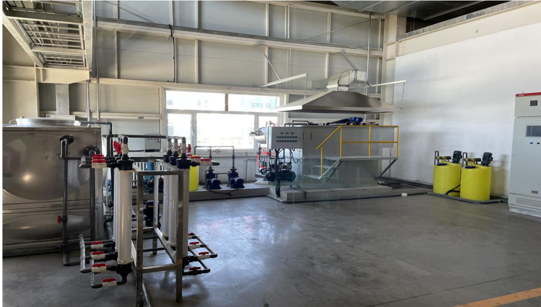
污水处理工序集气罩

污水站废水处理过程中产生的恶臭气体通过引风管道引至活性炭吸附+离子除臭工艺处理后，经过 15 米高排气筒排放（DA004）。