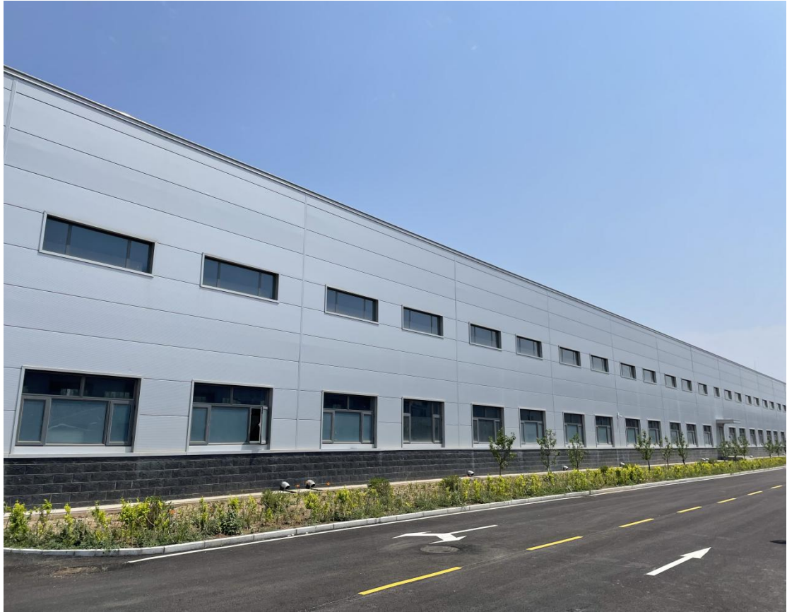
密闭厂房以及道路硬化、绿化图

无组织颗粒物、挥发性有机物通过密闭厂房，配合厂区道路硬化，洒水抑尘等措施，降低无组织排放污染物对周围环境的影响。