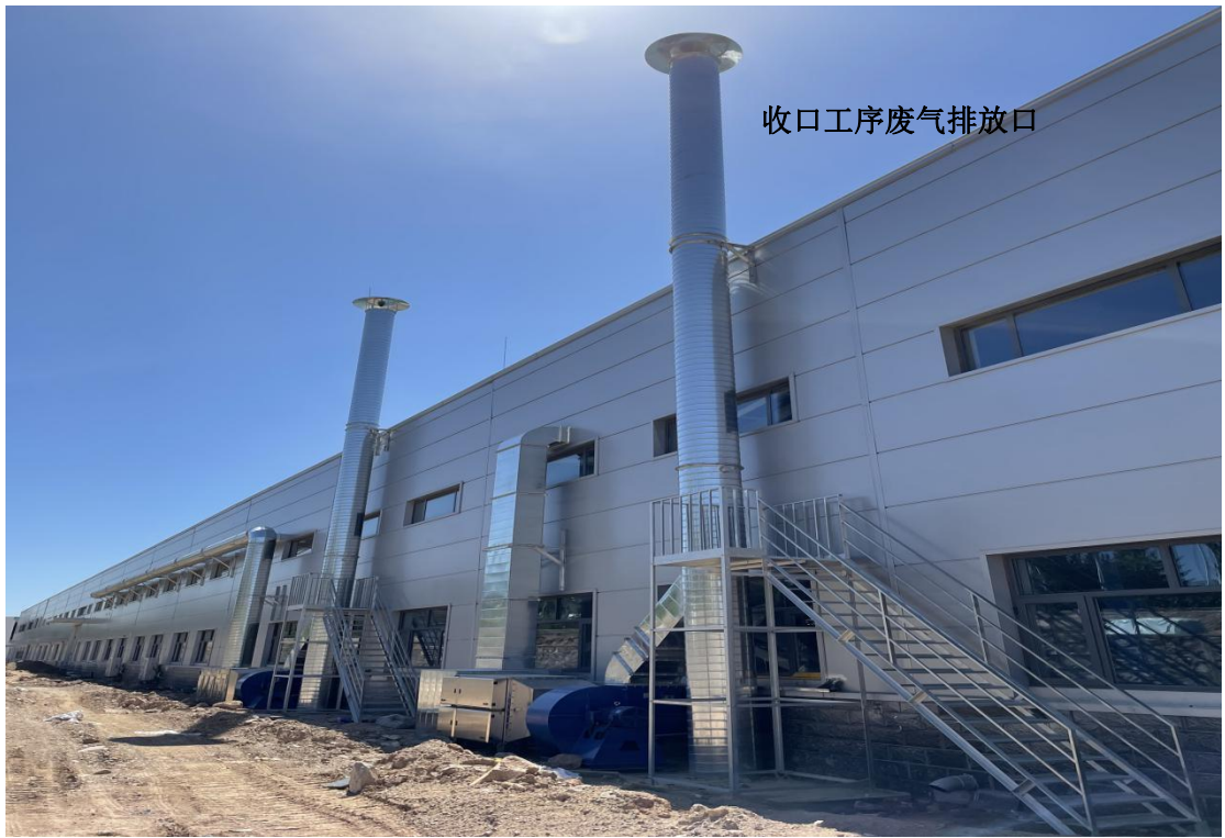
收口废气处理设施及排气筒照片（右1）