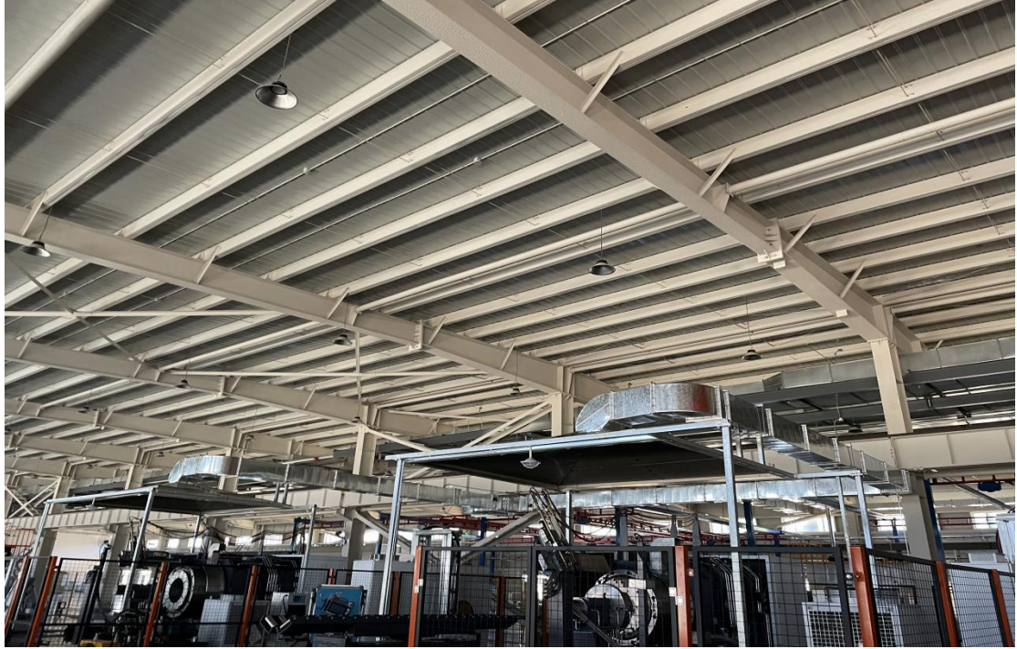
收口工序集气罩照片

本项目收口工序使用液化石油气，产生的收口废气采用高压静电吸附工艺+15m 排气筒排放（DA001）。