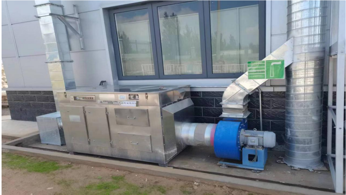
喷漆工序污染治理设施图

本项目喷漆工序废气经 UV 光解+活性炭吸附装置处理后,通过 15 米排气筒排放 (DA003)。