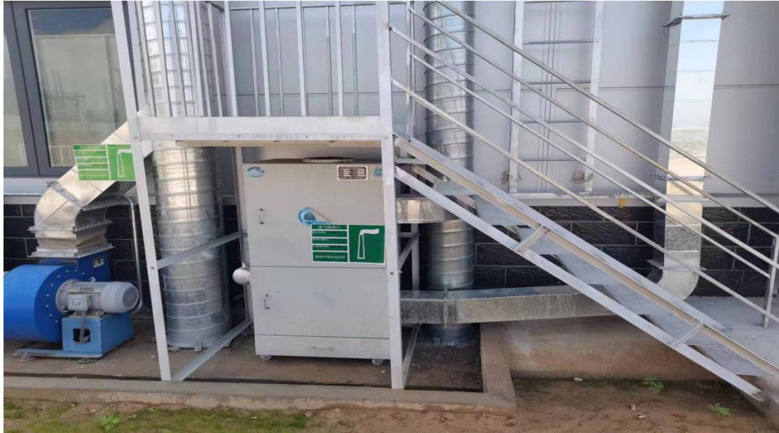
打磨工序污染治理设施

项目打磨工序产生的颗粒物经过集气罩收集+布袋除尘器处理后，经过 15 米高排气筒排放（DA005）。