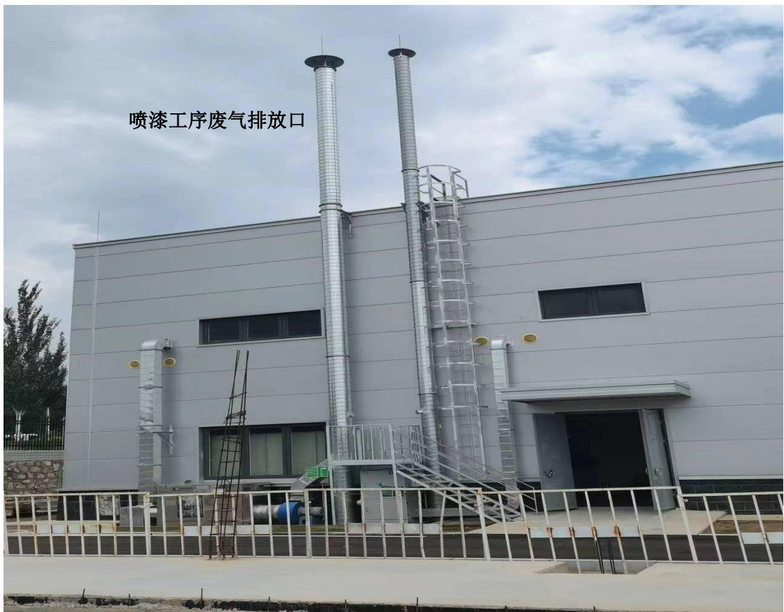
喷漆工序排气筒照片 (左 1)