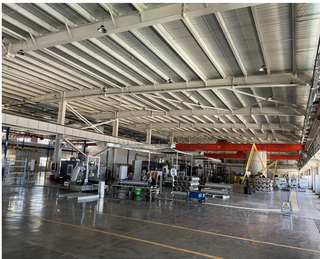
图 2-1 本项目部分生产区域

本项目工程主要建设处理规模为：本项目位于张家口市桥东区中心路以西和纬三路以南交叉口，项目总占地面积约 10000 平方米，总建筑面积约 10000 平方米，年产 2 万只Ⅲ型 35MPa 及以上压力的中大容积储氢气瓶。金属内胆生产及测试线 1 条，复合气瓶生产及测试线 1 条，系统装配生产及测试线 1 条。其中金属内胆生产及测试线面积约 4000 平方米，复合气瓶生产及测试线面积约 3000 平方米，系统装配生产及测试线面积约 2000 平方米，以及物料存储约 1000 平方米。新增拉深机、旋压设备、铝合金固熔炉等工艺设备 60 余台（套）。