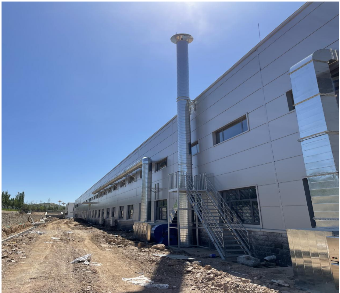
缠绕、固化、铝胆表面涂层废气处理设施及排气筒照片