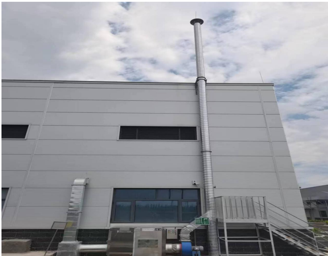
污水处理工序废气治理设施及排气筒照片